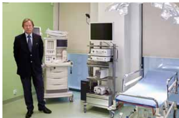
i Pracownię endoskopii.