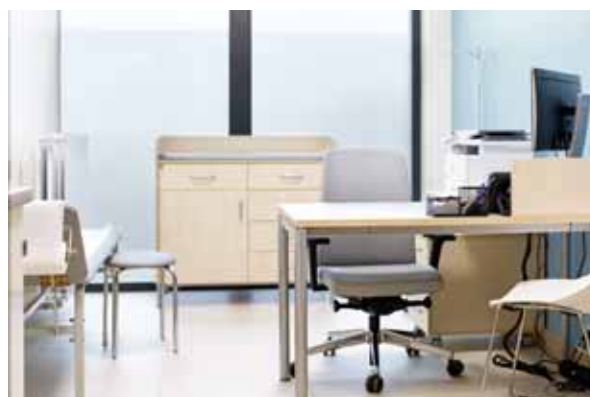
Gabinet lekarski POZ dla dzieci.

Do przychodni przy ul. gen. M. C. Coopera 5 przeniesiona została administracja Zespołu, wcześniej mająca swoją siedzibę w przychodni przy ul. Wrocławskiej 19.